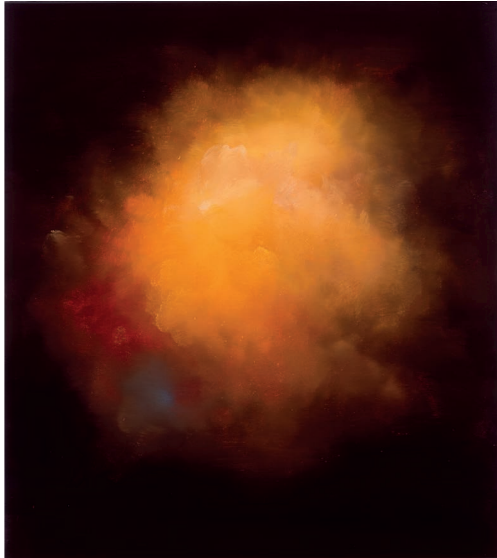
Cornelius Völker, Wolken, 2015, Öl auf Leinwand, 90 x 80 cm © VG Bild-Kunst Bonn 2019, Foto: Christoph Münstermann, Düsseldorf