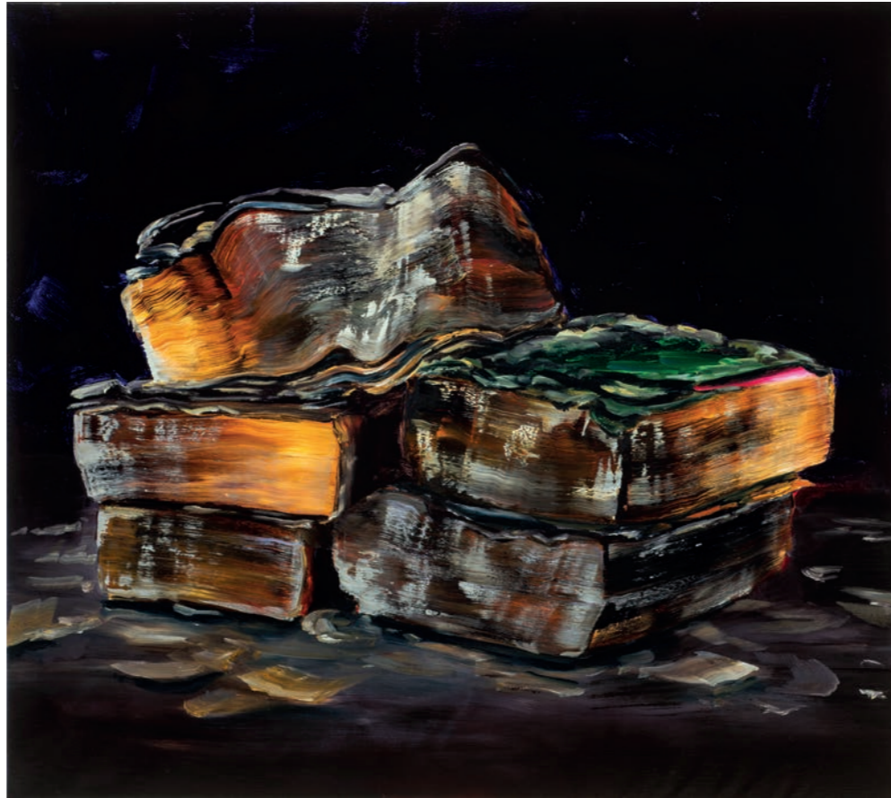
Cornelius Völker, Bücher/Asche, 2018, Öl auf Leinwand, 160 x 180 cm © VG Bild-Kunst Bonn 2019