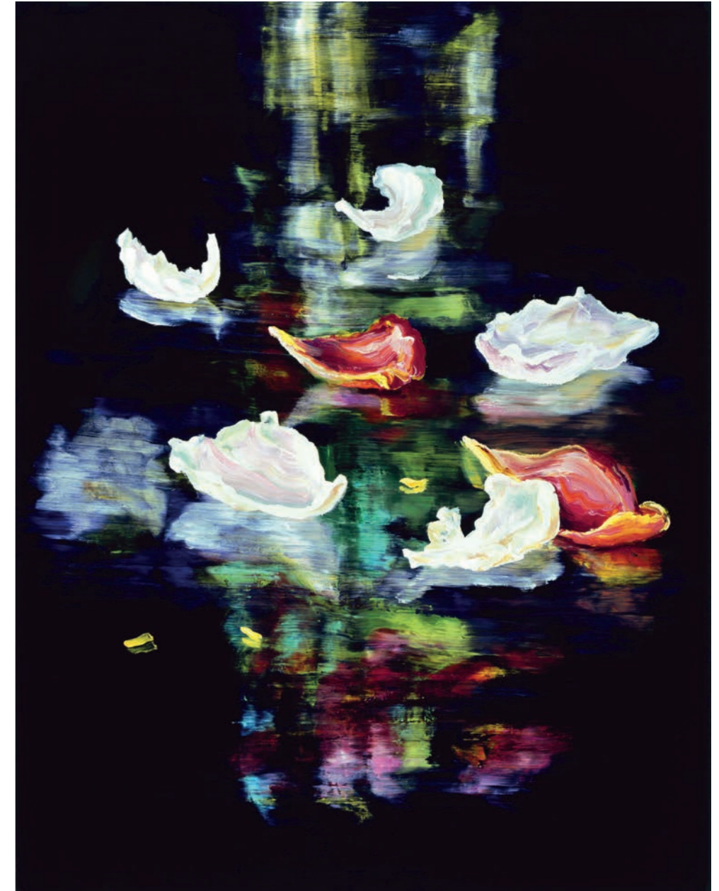
Cornelius Völker, Blüten, 2017, Öl auf Leinwand, 260 x 200 cm © VG Bild-Kunst Bonn 2019, Foto: Christoph Münstermann, Düsseldorf